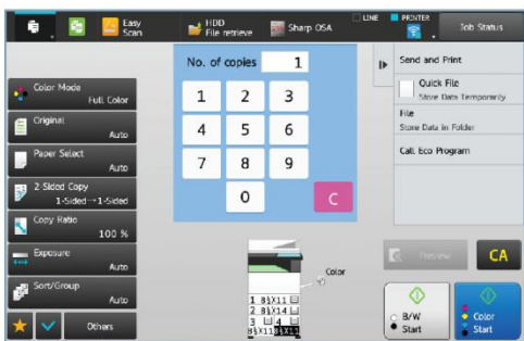
La pantalla de Copia Estándar ofrece funciones más avanzadas.