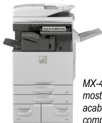
MX-4070N mostrado con acabadora interna compacta.

Cuando es tiempo de hacer el trabajo, los sistemas de documentos a color de la serie avanzada tienen un desempeño sobresaliente. Escanee rápidamente documentos a velocidades de hasta 200 imágenes por minuto . El reconocimiento óptico de caracteres (OCR) incorporado puede convertir sus documentos escaneados a formatos PDF con búsqueda de texto o Microsoft Office , simplificando su flujo de trabajo. Use la función de engrapado manual en acabadoras seleccionadas para reengrapar sus originales. Múltiples opciones de acabado le dan la salida que requiere, ya sea apilada, engrapada o engrapada a caballo. Incluso hay una función de engrapado sin grapas incorporada, que puede unir hasta cinco hojas de papel añadiendo una pinza a la esquina del juego, guardando las grapas normales para juegos más grandes.