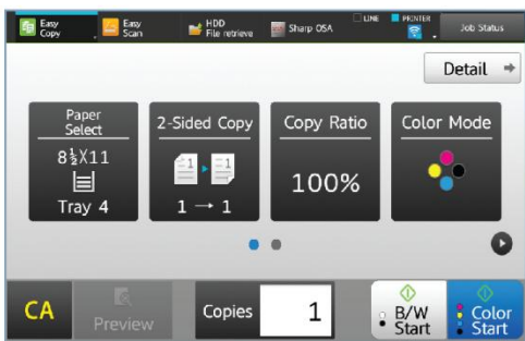
La pantalla de Copia Fácil ofrece la configuración usada con más frecuencia.