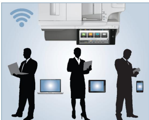
Interfaz de red inalámbrica incorporada para escaneo e impresión convenientes desde dispositivos móviles

Desde el manejo de papel hasta conexión a redes, la serie avanzada a color MX-3070N, MX-3570N, y MX-4070N superará sus expectativas.