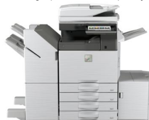
MX-4070N mostrada con acabadora de engrapado a caballo y cartucho de gran capacidad.